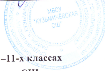
График оценочных процедур в 1–11-х классах МБОУ «Кузьмичёвская СШ» на 2024-2025 учебный год